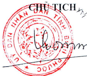
Trần Tuệ Hiền